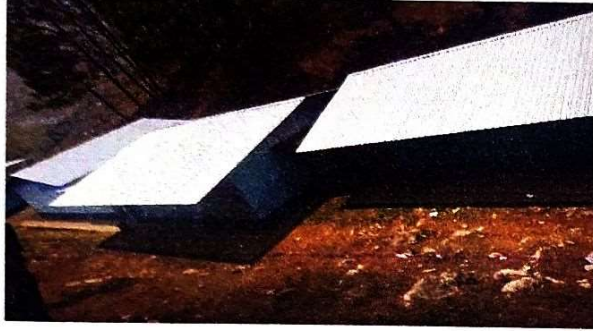
Foto 1: Modulo 3. Se observan las nuevas laminas troqueladas del entechado de las dos aulas y la cocina.