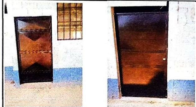
Foto 2: Modulo 2 Se realizo el cambio de una puerta de madera por una purta de metal de 200x94 cms. del deposito de agua y en la otra puerta cambio de chapa.